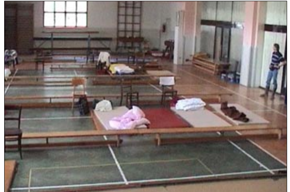
Evakuování obyvatelé byli ubytováni v sokolovně.