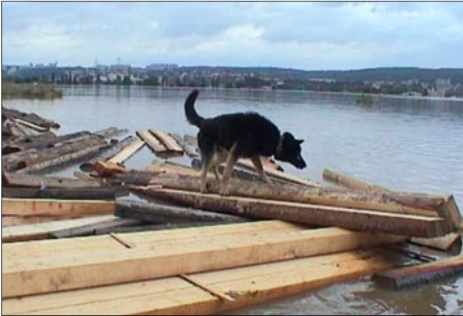
Majetek neochránil ani zámek, ani pes.