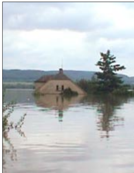
... pro postižené hrůzný zážitek.