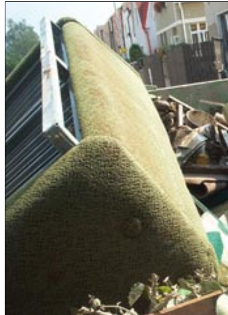
Návrat do vytopených bytů byl neradostný.