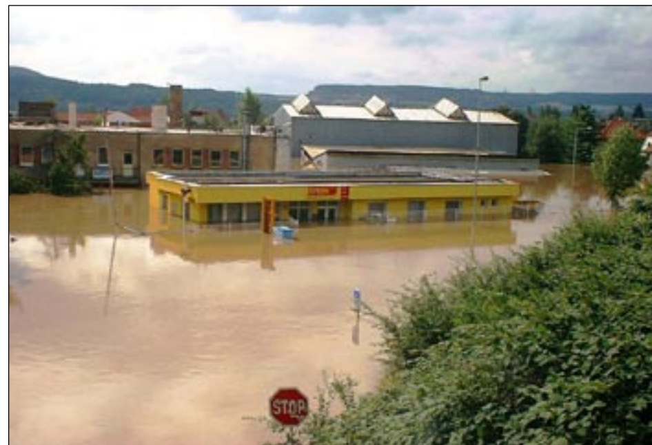
a sídlo sousední firmy Stahl, s částí ulice U Jankovky.