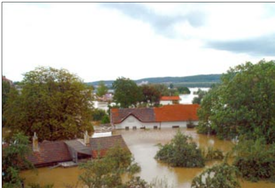
Ulice K Přívozu – mandlovna.