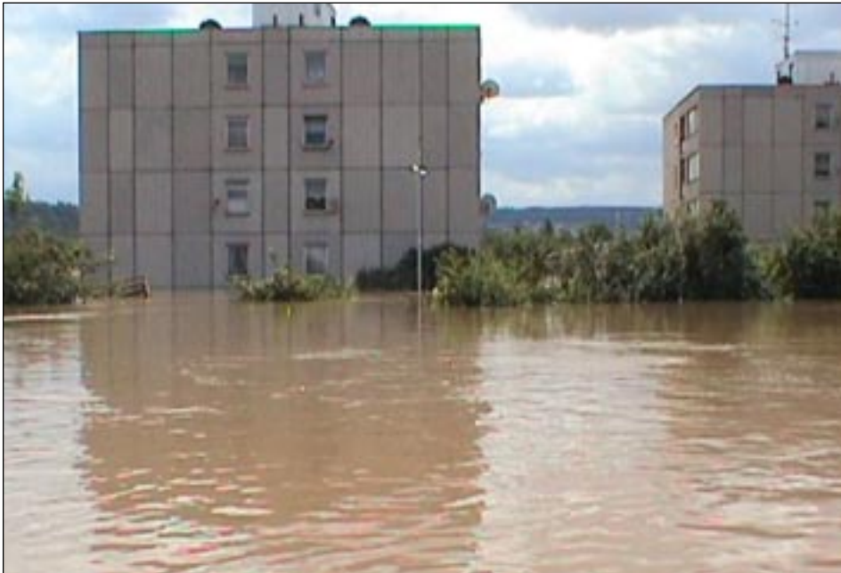
„Statkové domy“ čp. 1329, 1330 na Výpadové ulici.