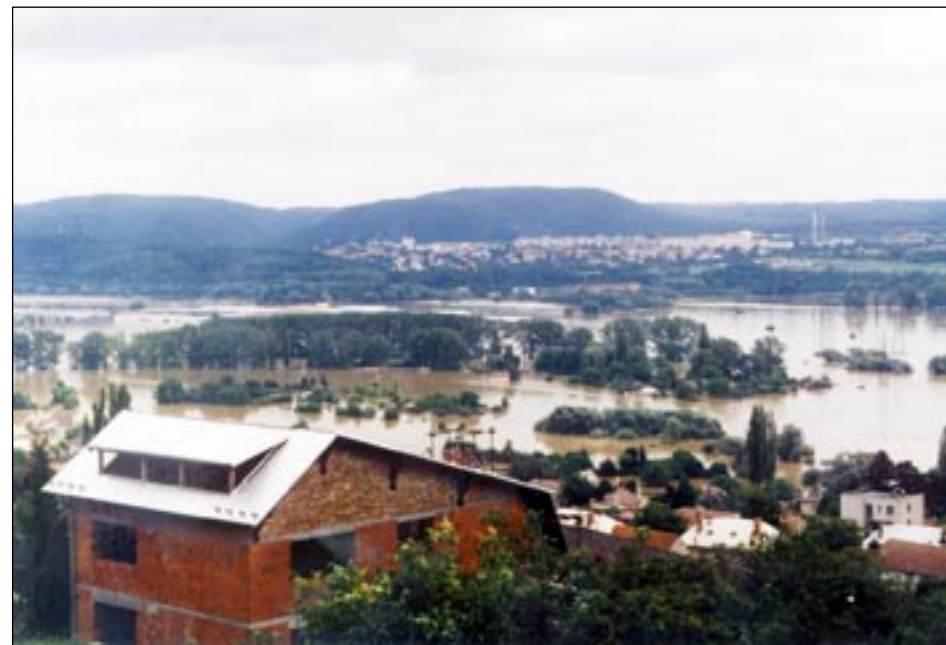
Zaplavená oblast Rymáně.