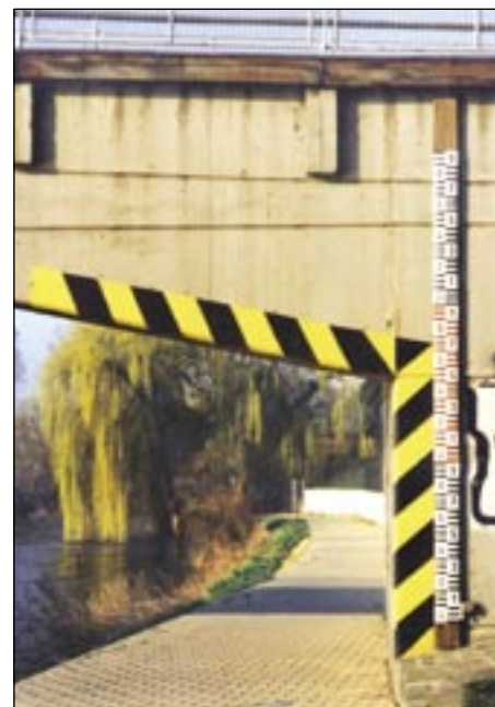
Vodočetná lat na lávce – při normálním průtoku