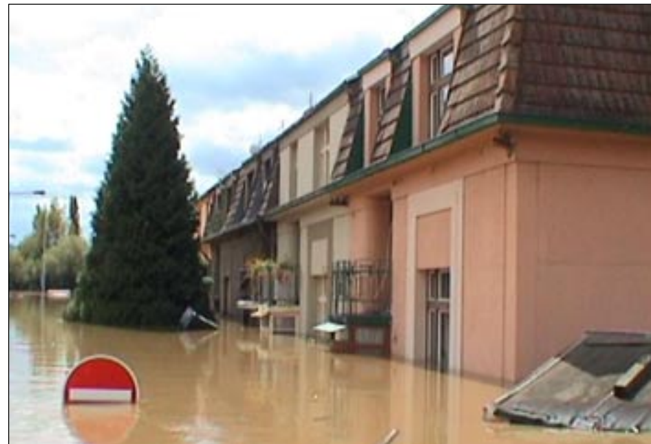
Ulice Na Benátkách.