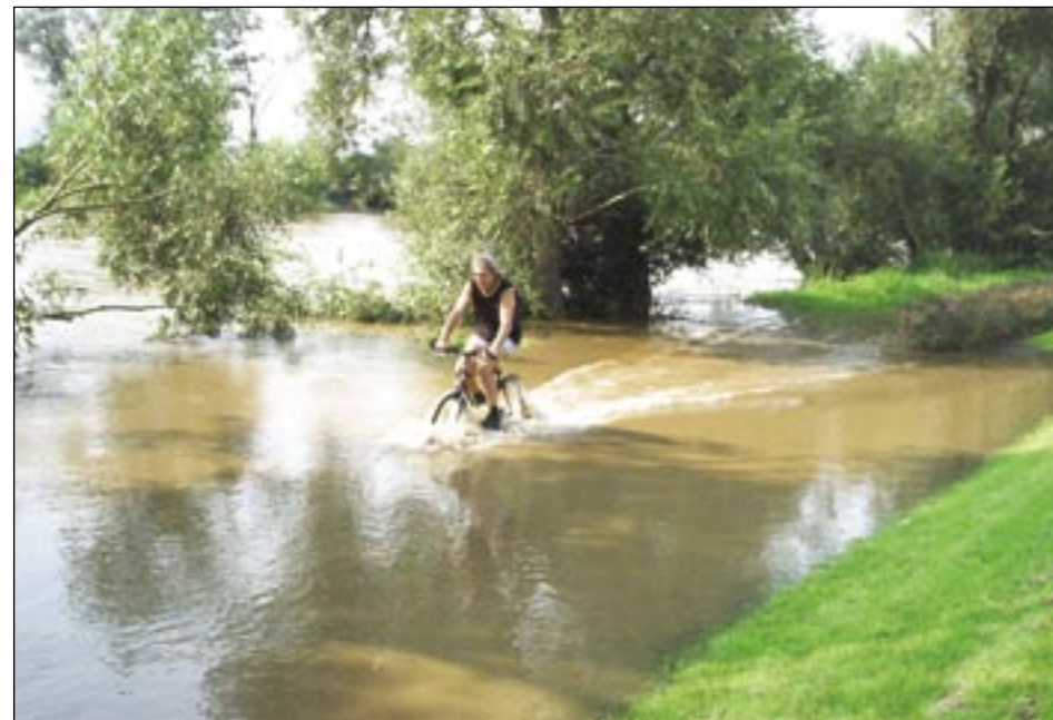
Začátek povodně vypadal nevinně – část cyklostezky pod vodou byla výzvou nejen pro kluky (11. 8.)