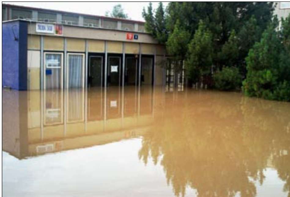
Vchod do základní školy.