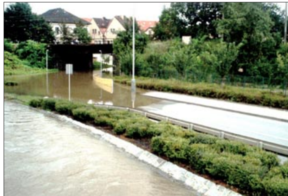
„Soutok“ Berounky a Radotínského potoka u podjezdu.