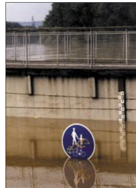
Tatáž lat při kulminaci (14. 8. 2002)