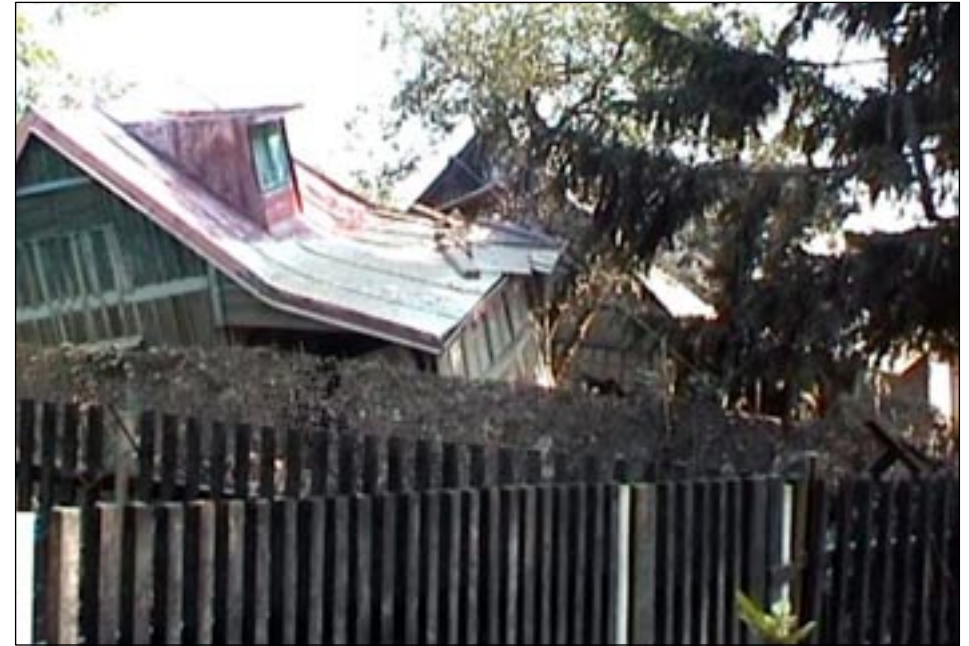
V Šárově kole voda bořila,