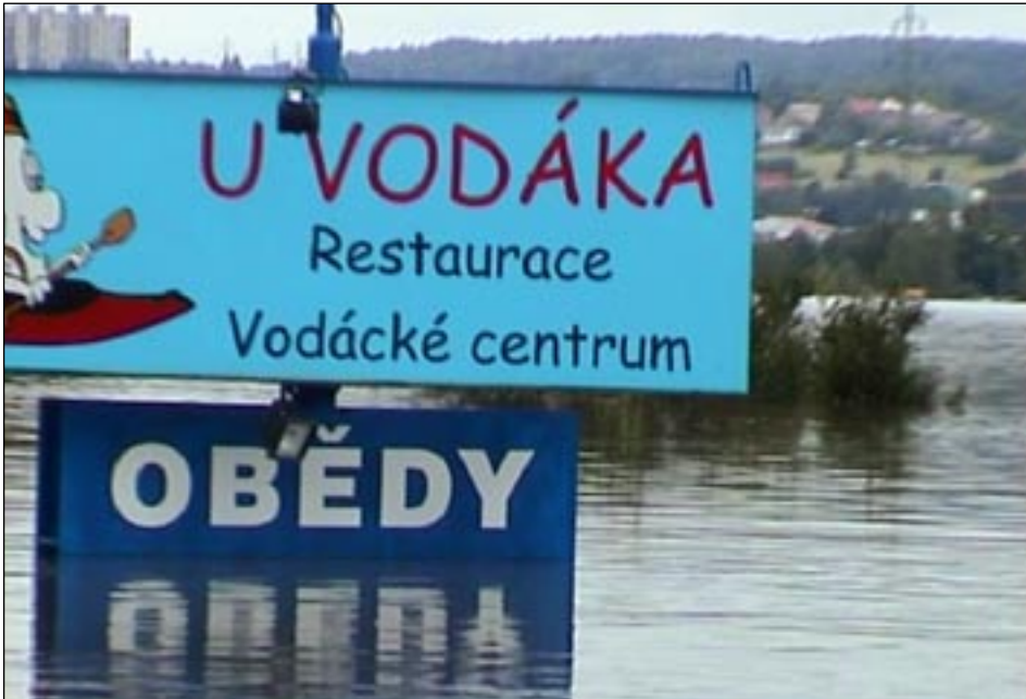
Následující den už by to nenapadlo nikoho – voda stoupla o další metry.