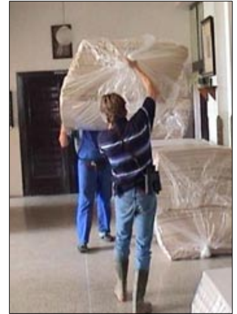
Již za povodně byla organizována humanitární pomoc