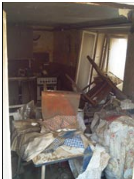
To nejtěžší ještě čekalo.