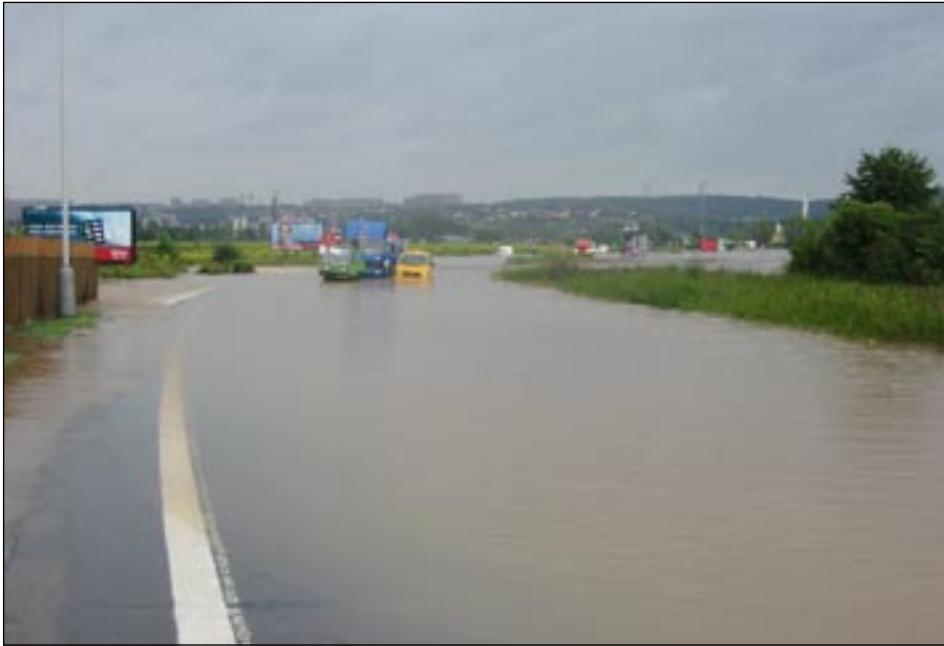
I když byla silnice do Lahovic zaplavena, mnozí ještě zkoušeli projet. (13. 8. – ráno)