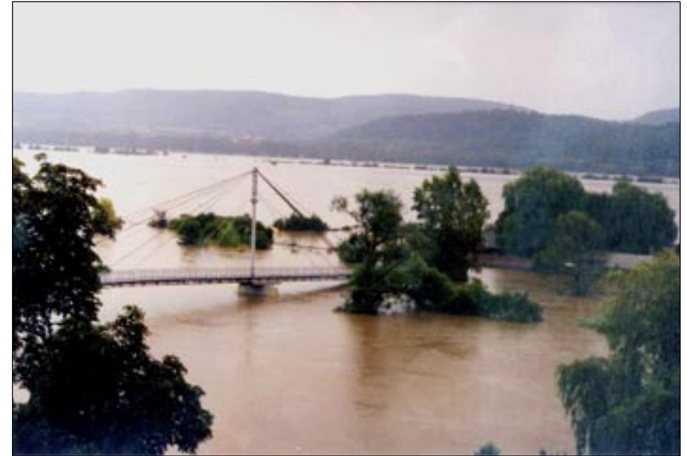
Řeka vytvořila „jezero“ mezi Radotínem a Zbraslaví.