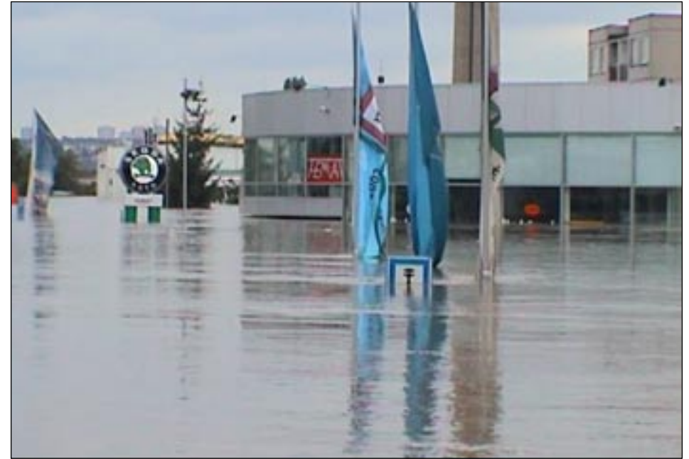
Výpadová ulice – Femat.