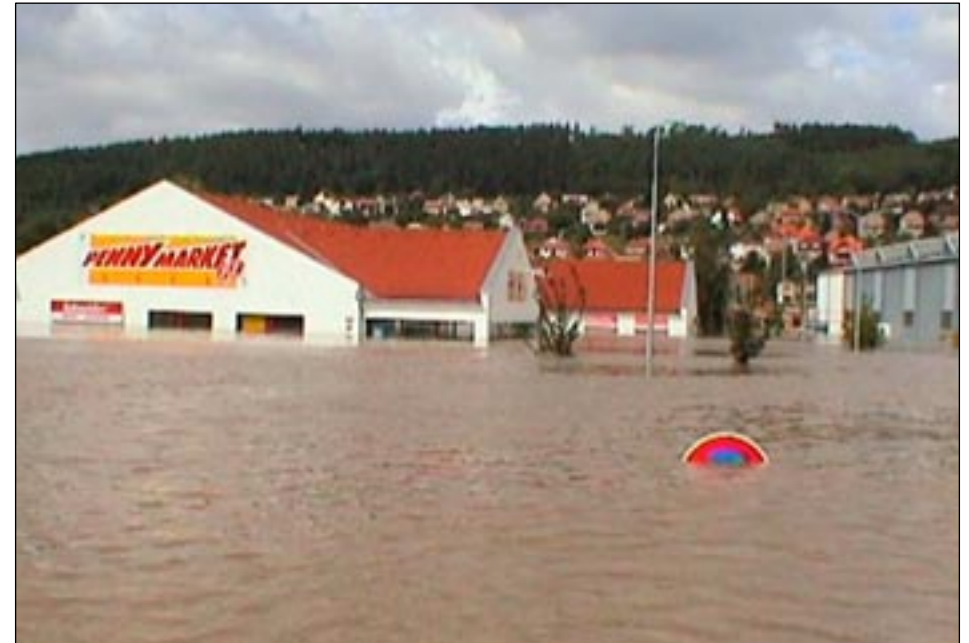
Věštínská ulice – Penny Market.