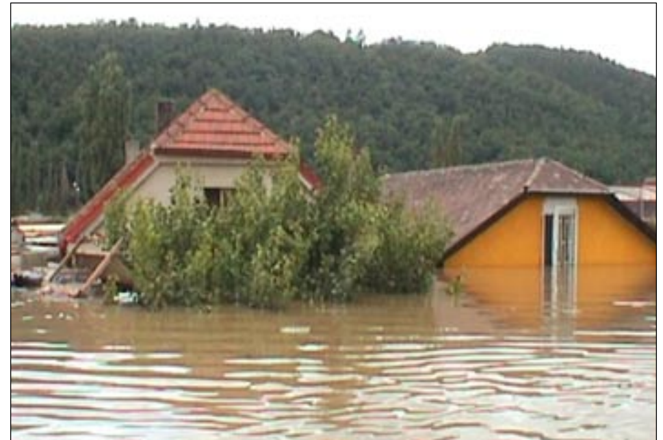
ale i tam, kde nebyl proud vody silný, voda ničila.