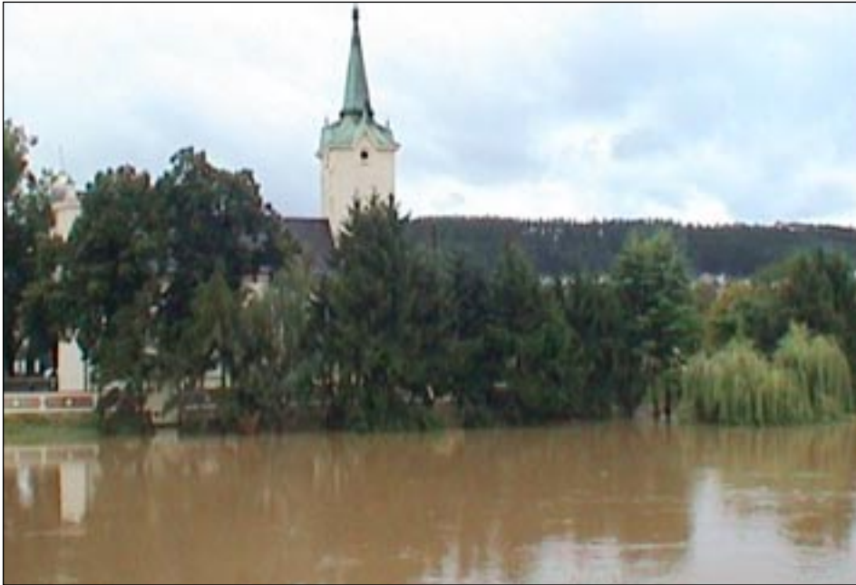
Berounka pod kostelem.