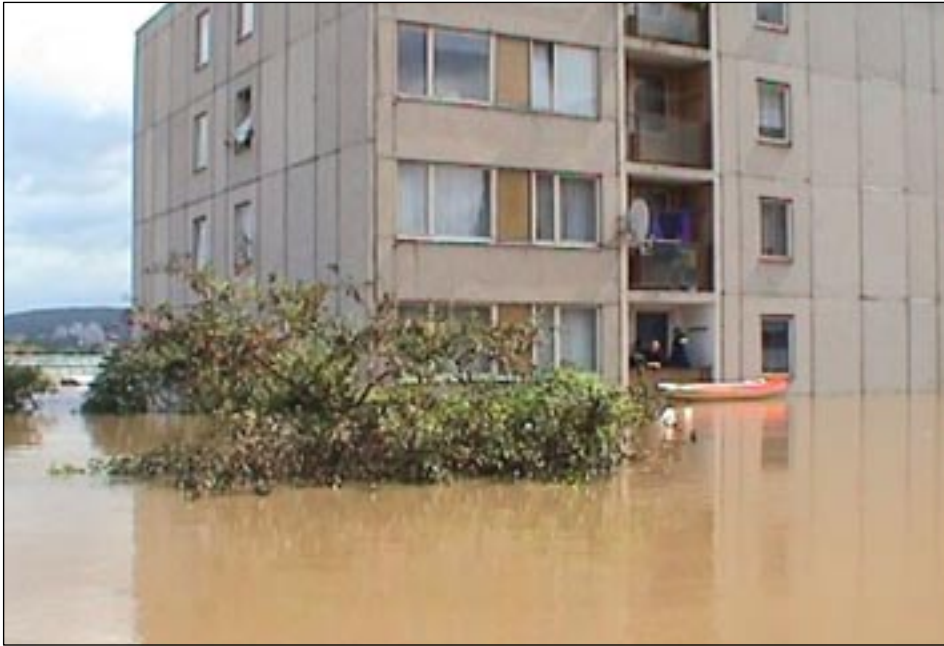
Ulice Výpadová, čp. 1317.