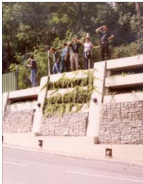
Pro ty šťastnější jen podívaná ...