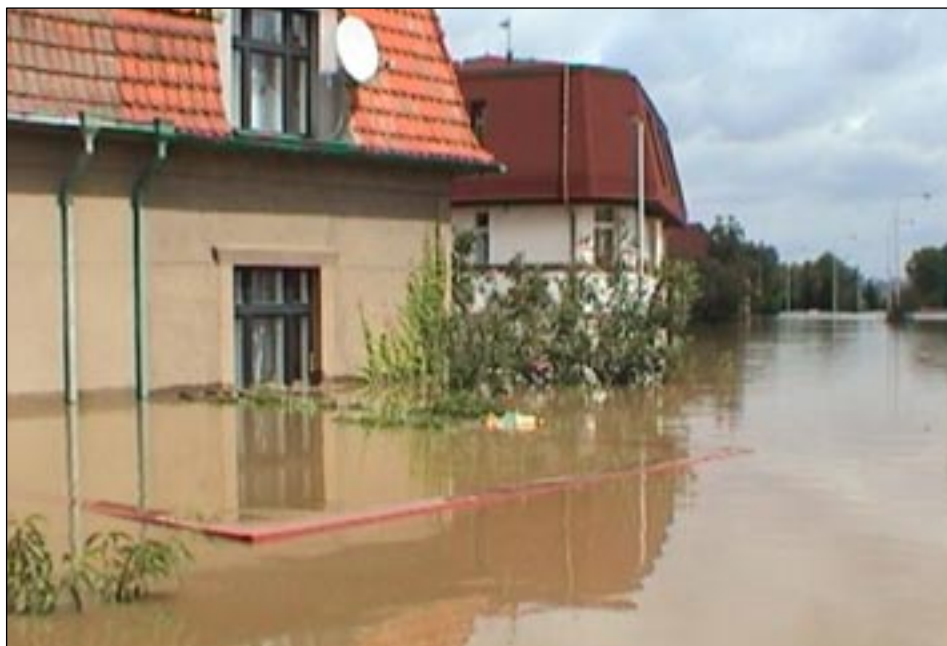
Výpadová ulice v okolí domu s pečovatelskou službou.