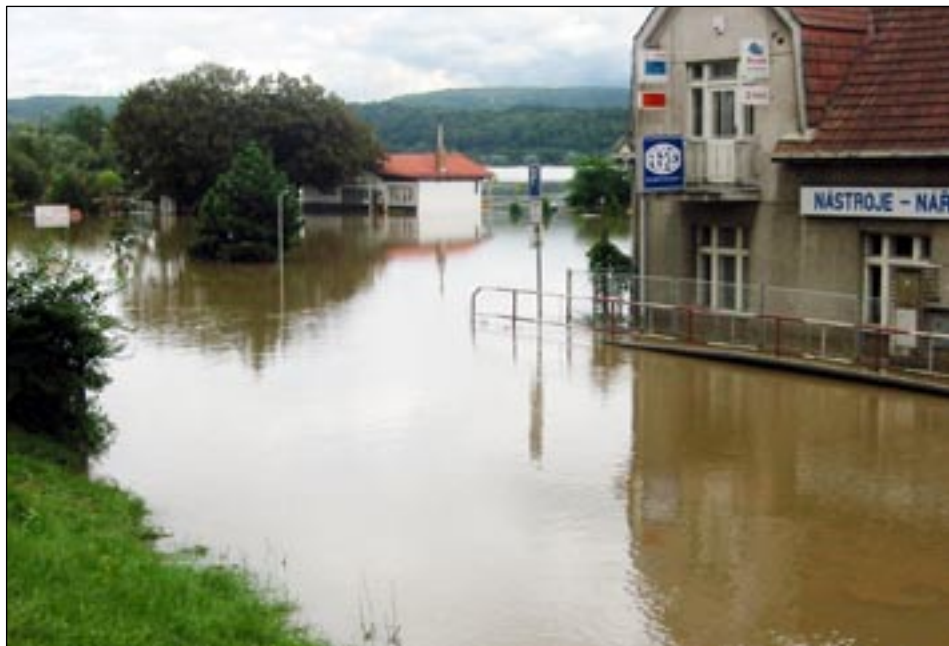
Výpadová ulice – parkoviště „U Ondřeje“.