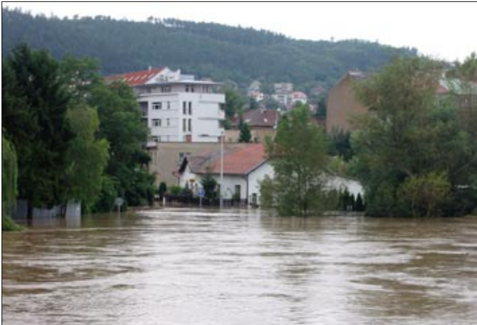
Místo skutečného soutoku Berounky a Radotínského potoka.