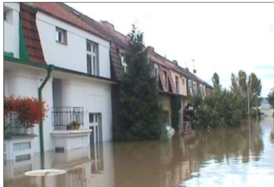
Ulice V Parníku.