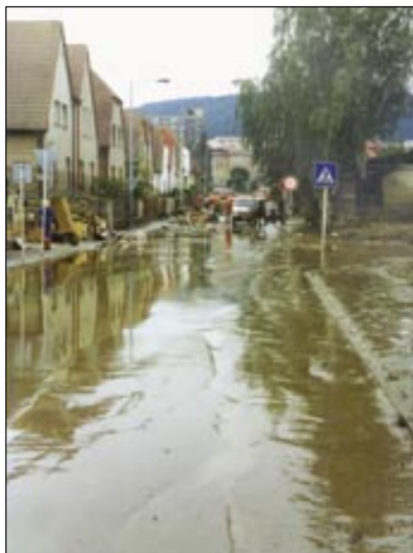
Voda opadla, zůstalo bahno.