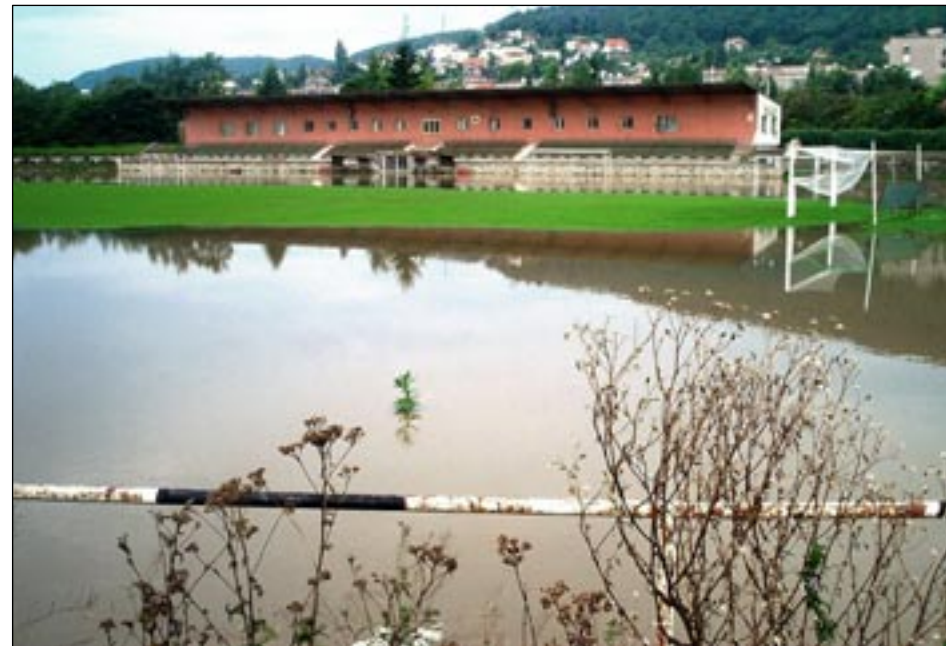
Ani hřiště RSK povodni neušlo.