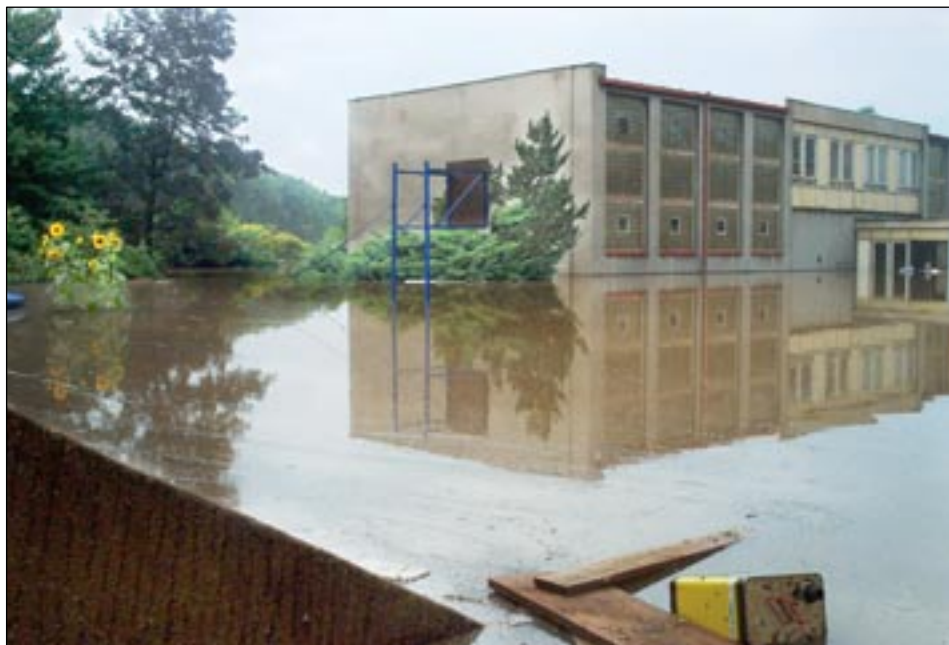
Začátek školního roku musel být odložen.