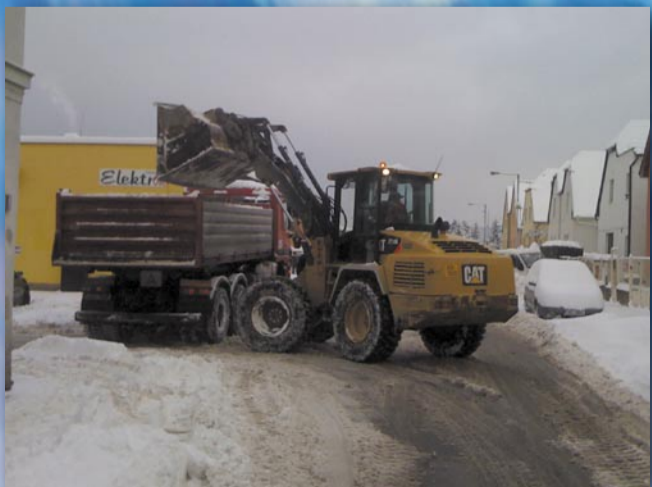
Díky těžké technice mizí sněh z ulic (Věštinská ulice, 11. ledna)