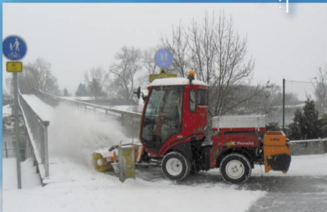
První nasazení techniky (stroj Rondó, ulice Václava Balého, 8. ledna)