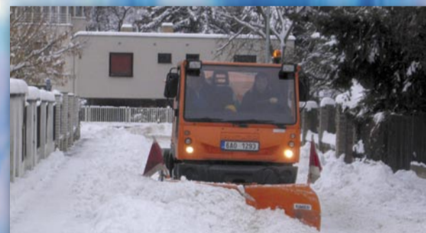
Zbraslavský víceúčelový stroj Bucher v akci (ulice Na Královně)