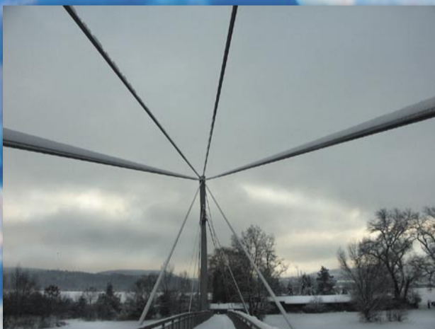
Lávka přes Berounku