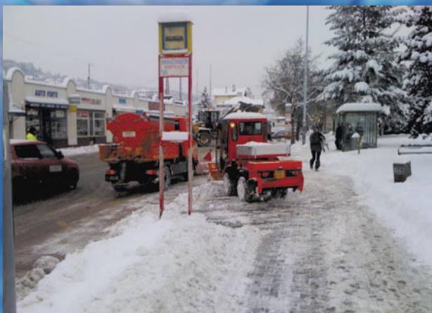
Odklizení bílé nadílky novými stroji (autobusové nádraží Radotín, 11. ledna)