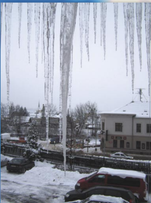
Ledová krása... ale také hrozba (náměstí Osvoboditelů, 12. ledna)