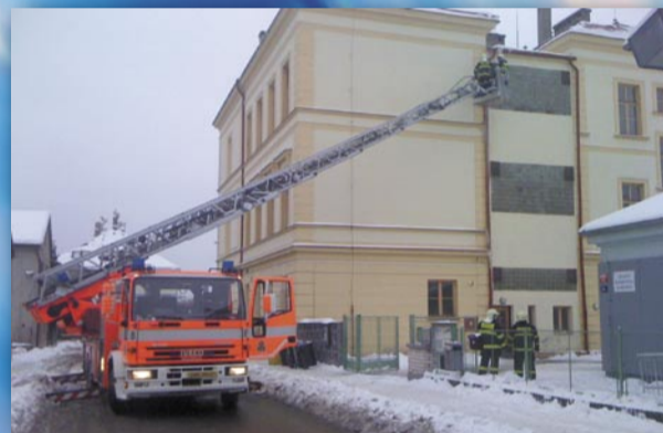
Hasiči zasahují ve školním areálu (Loučanská ulice, 14. ledna)