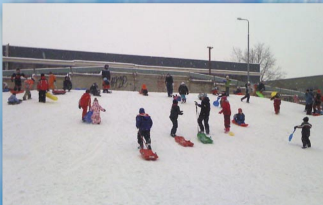
Děti sněh potěšil (radotínské nové sídliště)