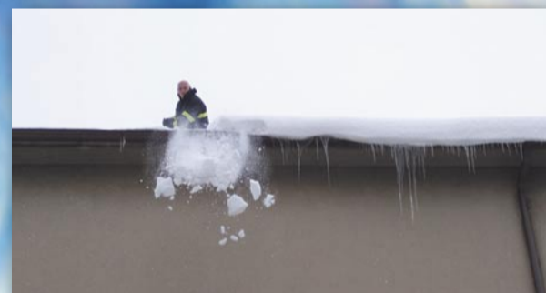
Dobrovolní hasiči shazují nebezpečné převisy ze střech (Sídliště, 13. ledna)