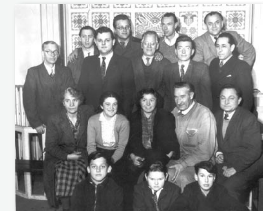
Členové loutkářského souboru někdy kolem roku 1955