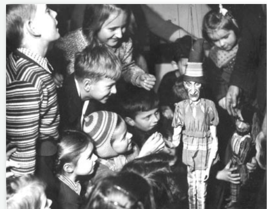
Děti s loutkou, asi Dlouhého. Tato postava z původního fundusu se nedochovala