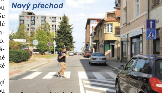
3x foto: Pavel Jirásek