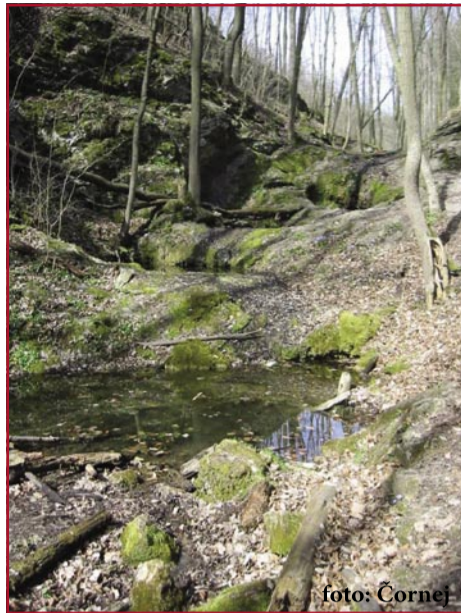
Kaskáda Bubovických vodopádů téměř bez vody

sloužil lom Mexiko coby trestanecký tábor pro politické vězně, jimž je nad