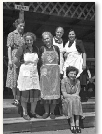
K zázemí divadla patřil samozřejmě bufet.