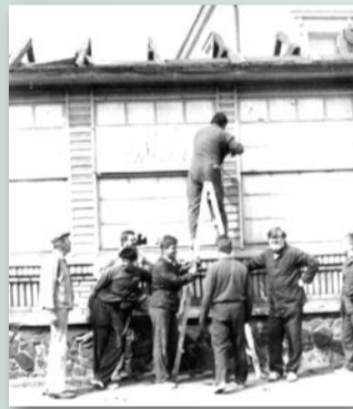
Bylo rozhodnuto, že stavba proběhne ve dvou etapách, nejprve se postaví budoucí sál s jevištěm a pak se stávající sál (na obr.) zboří a místo něj bude nový vstup divadla, foyer s šatnou a technická kabina