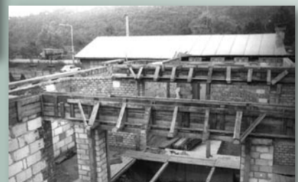
Po úspěšných divadelních sezónách se na popud tehdejšího zřizovatele, Kulturního domu MNV Zbraslav, započalo v rámci akce „Pražané svému městu“ na místě stávajícího divadélka se stavbou nové divadelní budovy. Dosavadní divadélko nemělo toalety pro diváky, natož pro účinkující, ani pořádné technické zázemí či skladovací prostory (v pozadí stávající divadelní pavilón)