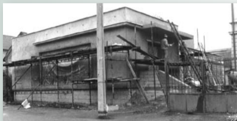
Dokončování nové budovy divadla. Na jaře 1989 se nové divadélko otevřelo a dostalo také dnešní název Divadlo Jana Kašky - zbraslavského rodáka, člena divadelní družiny J. K. Tyla. Jeho unikátem byly konstrukce jevištní technologie s pohyblivými lávkami pro vodiče. Díky tomu je možno na jedné scéně hrát činoherní i loutkové divadlo