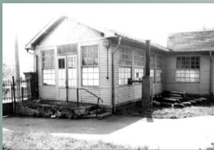
Staré divadlo – v té době byl místní národní výbor v dnešním Městském domě, pavilon, z něhož se vybudovalo loutkové divadlo, bývalá letní restaurace s připojeným kuželníkem

Na přerušenu tradici navázal v roce 1983 loutkářský soubor Rolnička, zřizovaný tehdejšími Kulturním domem MNV na Zbraslavi. Jako svou domovskou scénu si členové souboru svěpomocí přebudovali nevyužívaný dřevěný pavilon letní jídelny bývalého hotelu Praha.