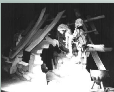
Během pouhých dvou sezon soubor secvičil šest inscenací. Jednou z nich byl Ostrov splněných přání; scénu vytvořil akademický malíř Petr Hampl, který hru také režíroval