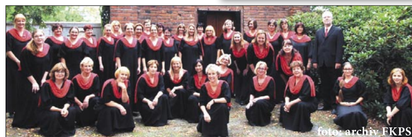
Foerstrovo komorní pěvecké sdružení patří k nejlepším ženským sborům

Koncert Foerstrova komorního pěveckého sdružení v úterý 20. září od 19.00 hodin v kostele farního sboru Českobratrské církve evangelické v Radotíně, Na Betonce 14